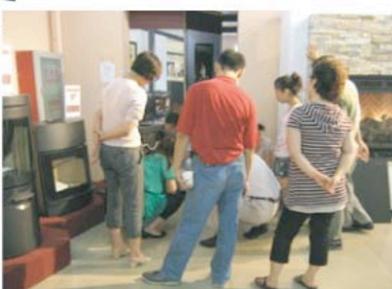
北京のショールームでの HWAM 講習会