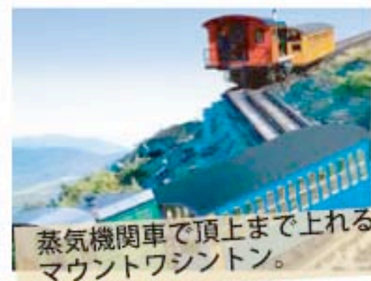
蒸気機関車で頂上まで上れるマウントワシントン。