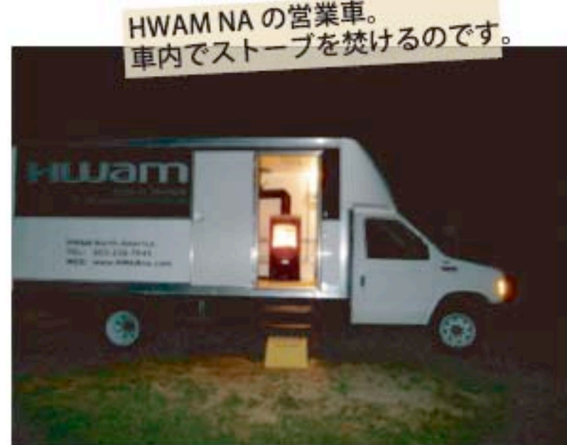
HWAM NA の営業車。車内でストーブを焚けるのです。