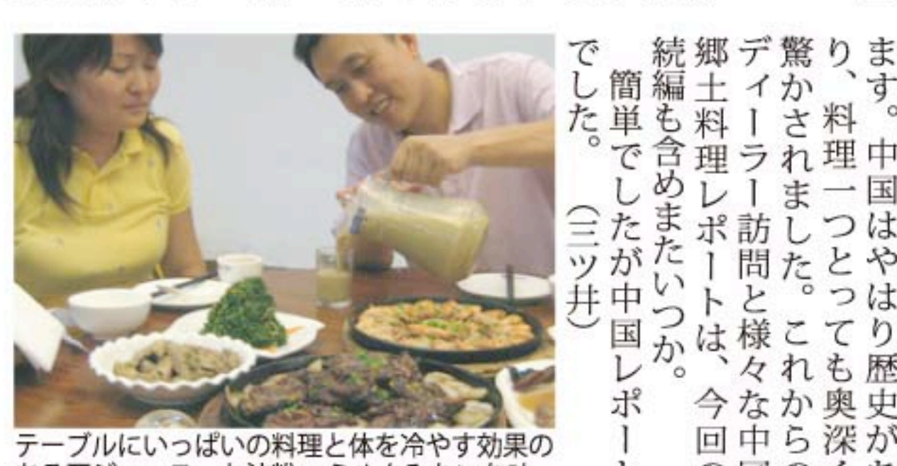
テーブルにたっぷりの料理と体を冷やす効果のある豆ジュース。お汁粉+ミルクみたいな味。

今回は北京、上海、杭州の三都市でした。本文でお伝えしたのは残念ながら滞在中頂いた料理のほんの一部です。私達のデイトトリビューターは西安や昆明などあと五ヶ所あります。中国はやはり歴史があり、料理一つとっても奥深く驚かされました。これからのデイトトリビューター訪問と様々な中国郷土料理レポートは、今回の続編も含めたいです。