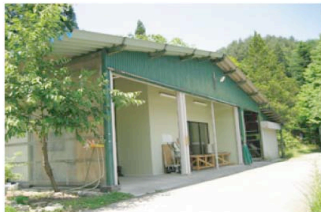
yuicaを生産している『正プラス (セイプラス)』の工場

さて、この木から抽出された一〇〇%純粋なオイルには、ほっとする気があるだけではない、こんな事実があります。知っていましたか？ 植物の精油には、フィトンチッドという成分がたくさん含まれています。これは樹木などが傷つけられたときに放出される、その周囲にいる細菌などが生きられない、つまり殺菌効果があることが確認されています。《森林浴》という言葉をよく耳にしますが、その森林浴の効果はフィトンチッドの作用によって起こると言われています。 以前は、森林浴の効果は精神的なものが多いと考えられていましたが、現在では唾液や鼻の粘膜、脳波測定等から、科学的な根拠が示されるようになってきたのだそうです。また、都市部のサラリーマンを対象とした