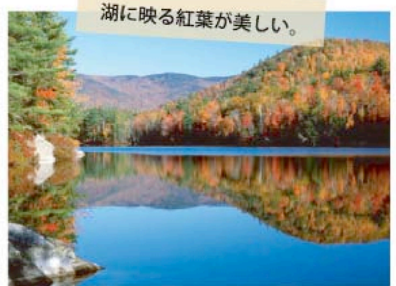
湖に映る紅葉が美しい。

Plymouth は三千人が住む小さな町ですが、さらに五千人ほどの学生が町の中心にある Plymouth 大学へ通っています。