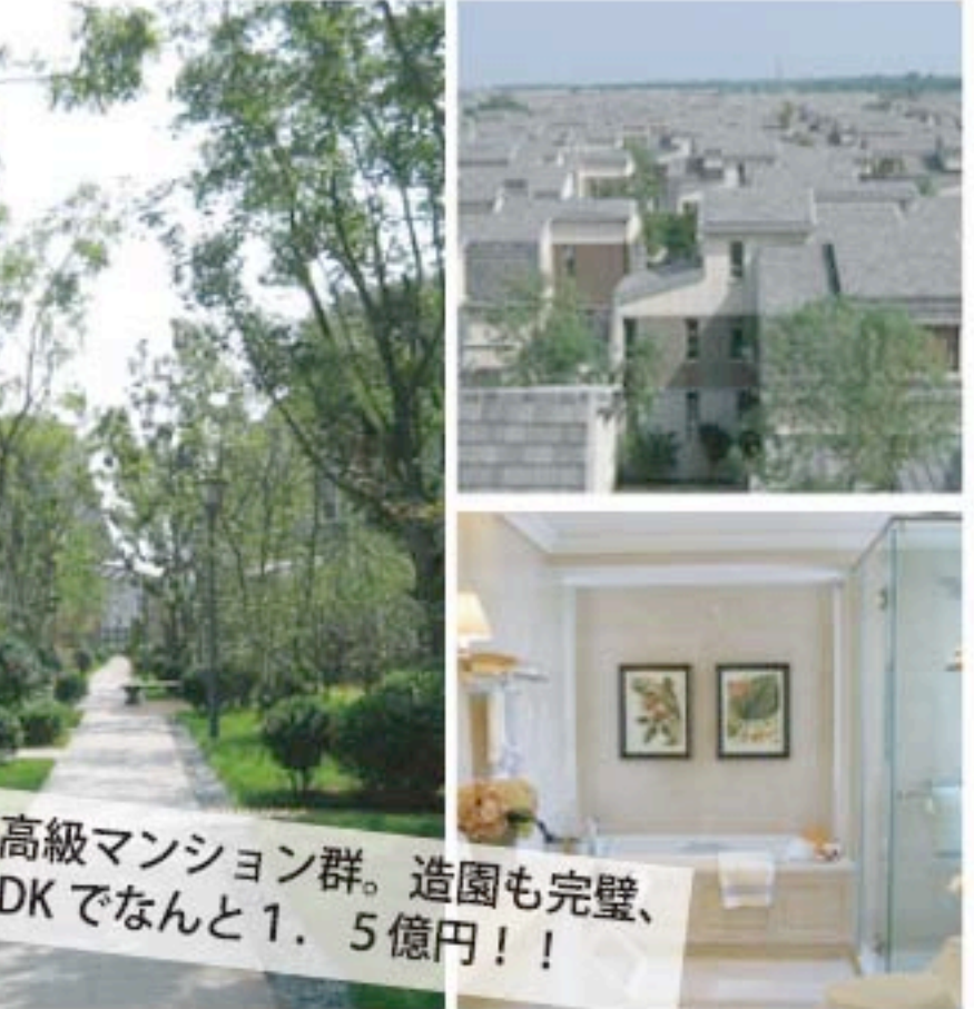
超高級マンション群。造りも完璧、3LDK でなんと 1.5 億円！！

中国は猛ビッチで開発が進んでいます。富裕層と言われる人々が増え、西洋型のライフスタイルを求め、薪ストーブや暖炉もそのステータスとして注目を集め始めています。まだまだ販売台数は中国全土で日本の半分にも満たない数字ですが、大都市にはそれぞれ数件のストーブショールームがあり、ショールームも皆日本に引けを取らない体制で営業をしています。