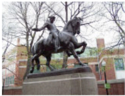
オールドノース教会の前に建つポール・リビア像

でもありません。四月十九日の独立戦争勃発の記念を祝う日です。ボストンマラソンの始まりは、この独立戦争の契機となり、レキシントン・コンコードの戦い、の前夜ポール・リビアライド(真夜中の疾風)に由来しているそうです。 一七七五年四月十八日深夜、イギリス軍が攻めてくるという知らせが、もしイギリス軍が陸から攻めて来たならランタンを一つ、海から攻めて来たならランタンを二つ、オールドノース教会の塔にともすことを決めた。