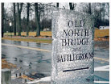
オールドノースブリッジ、コンコード 1775年4月19日イギリス兵とアメリカ農兵がここで衝突した

でもありません。四月十九日の独立戦争勃発の記念を祝う日です。ボストンマラソンの始まりは、この独立戦争の契機となり、レキシントン・コンコードの戦い、の前夜ポール・リビアライド(真夜中の疾風)に由来しているそうです。 一七七五年四月十八日深夜、イギリス軍が攻めてくるという知らせが、もしイギリス軍が陸から攻めて来たならランタンを一つ、海から攻めて来たならランタンを二つ、オールドノース教会の塔にともすことを決めた。